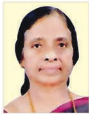
കുരുതുകുളങ്ങര പെല്ലിശ്ശേരി ദേവസ്സി സുസീ 13.06.24