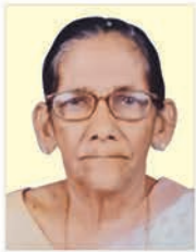
മുത്തപ്പിടിക ഓസേബ് ഭരണി 29.07.24