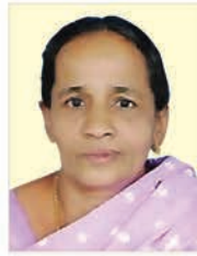
വടക്കേത്തല റസായി ഭരണി 01.05.24