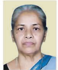
ചാലിശ്ശേരി വീത് സെലിന് 06.03.24