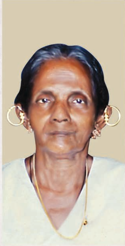
അരിമ്പുള് മുത്തിപ്പീടിക ലാസർ മകൻ പൊറിഞ്ചു