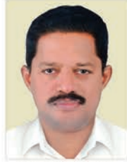
കണ്ണമ്പുഴ വള്ളുപ്പാറ തോമ ജാത്യു 16.12.23