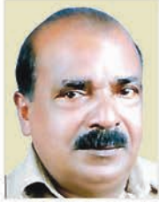
വേലൂക്കാക്കര റസായി ജോയ് 22.11.23