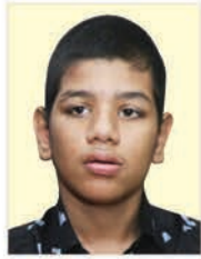
തെക്കിനിയത്ത് കുഞ്ഞാമര സെബിൻ അഭിനവ് 16.04.24