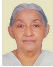
കുറ്റിക്കാട്ട് പൊറിഞ്ഞു കൊച്ചുശ്ശേരപ്പ 20.03.24