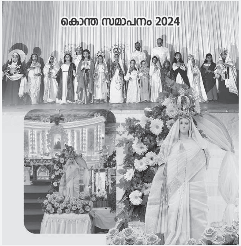
സ്നേഹിക്കാത്തവനാകട്ടെ മരണത്തിൽ തന്നെ നിലകൊള്ളുന്നു. (1 യോഹ. 3 : 14 )