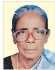
ആലപ്പാട് പെന്തേക്കൽ ലോനൺ ഭരണി 11.09.24