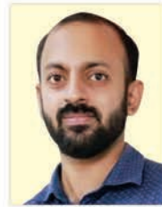
കുരുതുകുളങ്ങര അക്കര ജോസ് ഫെസ്റ്റിൻ 28.07.24