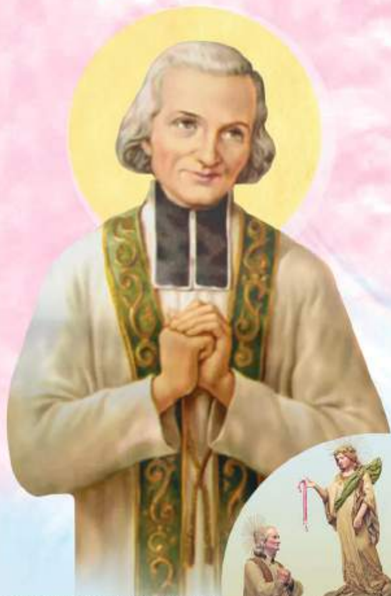
സെന്റ് ജോൺ മരിയ വിയാനി യൂണിറ്റ്