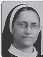
സി. മേരി CMC 15/08