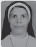
സി. നിയ ജീസ് 8/9

സെപ്റ്റംബർ മാസത്തിൽ നാമഹേതുക തിരുന്നാൾ ആഘോഷിക്കുന്ന നമ്മുടെ ഇടവകയിലെ സമർപ്പിതർ